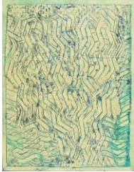
Max ERNST Les jeunes et les jeux twistent 1964 Öl auf Leinwand 116 x 89 cm Signiert unten rechts: 'Max Ernst' Betitelt, signiert und datiert verso: 'Twist Max Ernst 64'