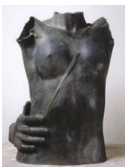
Igor MITORAJ Eros II 1982 Bronze 106 x 76 x 42 cm Signiert und nummeriert