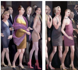
Volker STELZMANN Triumphzug 2011 Diptychon, Mischtechnik auf Nessel auf MDF Linke Seite: 180 x 100 cm, rechte Seite: 180 x 70 cm Monogrammiert, datiert und lokalisiert