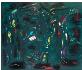
André MASSON La Mort d'Holopherne 1959 Öl auf Leinwand 110 x 130 cm Rückseitig mit Signaturstempel und Nachlassstempel versehen