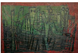
Karel APPEL Begging Children 1948 Öl auf Leinwand 70 x 104 cm Signiert unten rechts: 'K. Appel'